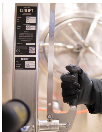
Molla a gas alimentata