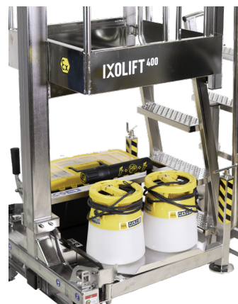
Vassoio porta attrezzi